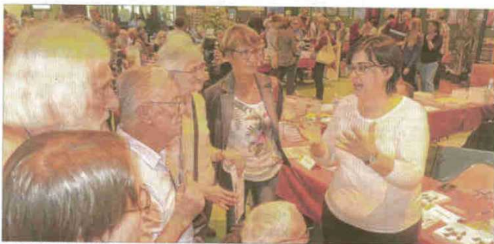
Visite du salon, au milieu de la foule, pour sept artistes du centre culturel Arièle de Turin, qui y exposent leurs œuvres.

La première réaction de la lauréate sur www.ledauphins.com