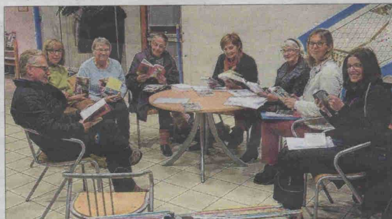
Le comité de lecture d'Hermillon travaille déjà pour l'attribution du prochain prix Rosine Perrier.

Concernant le concours d'affiches, il a été présenté courant décembre auprès des étudiants de 1 er année de