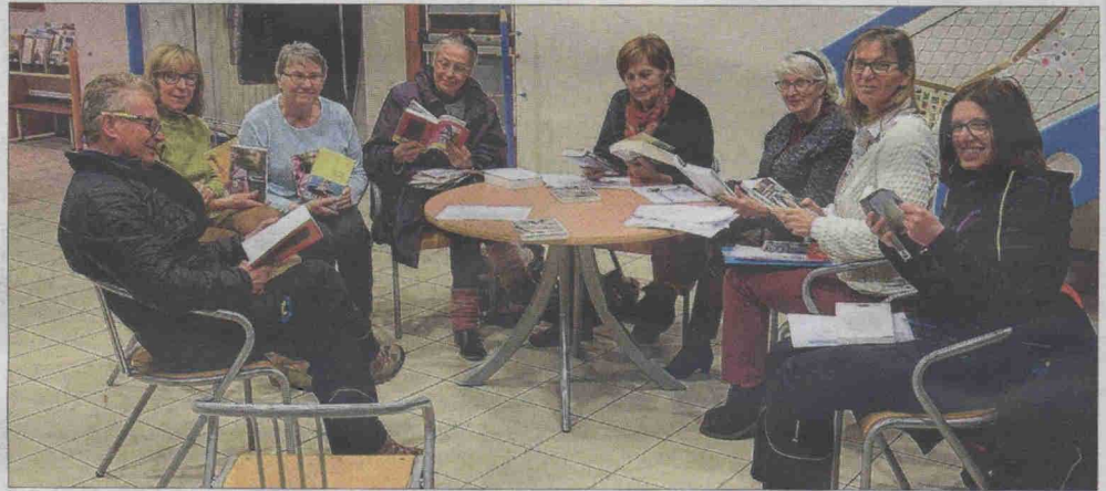
Le comité de lecture découvrait les 12 ouvrages retenus pour le prix Rosine Perrier.