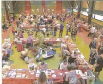
Durant deux jours les visiteurs se sont succédé dans les allées du salon.