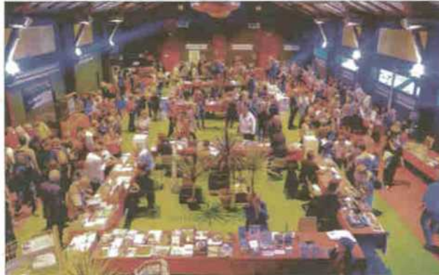
Le Salon du Livre d'Hermillon sera ouvert de 10h à 18h samedi et de 10h à 17h30 dimanche.

Laissez vos pas vous guider ! Dès le samedi matin, la Cie Dos Mundos al-Arte ravira le jeune public et l'apéro littéraire avec les auteurs en lice pour le prix Rosine Perrier permettra d'échanger en toute simplicité.