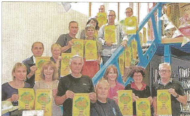
L'équipe du "Colporteur" présentant l'affiche officielle du 29 e salon.